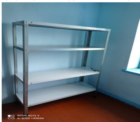
Стеллаж для овощей и фруктов