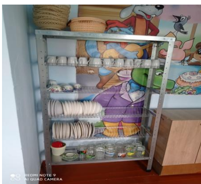
стеллаж для посуды